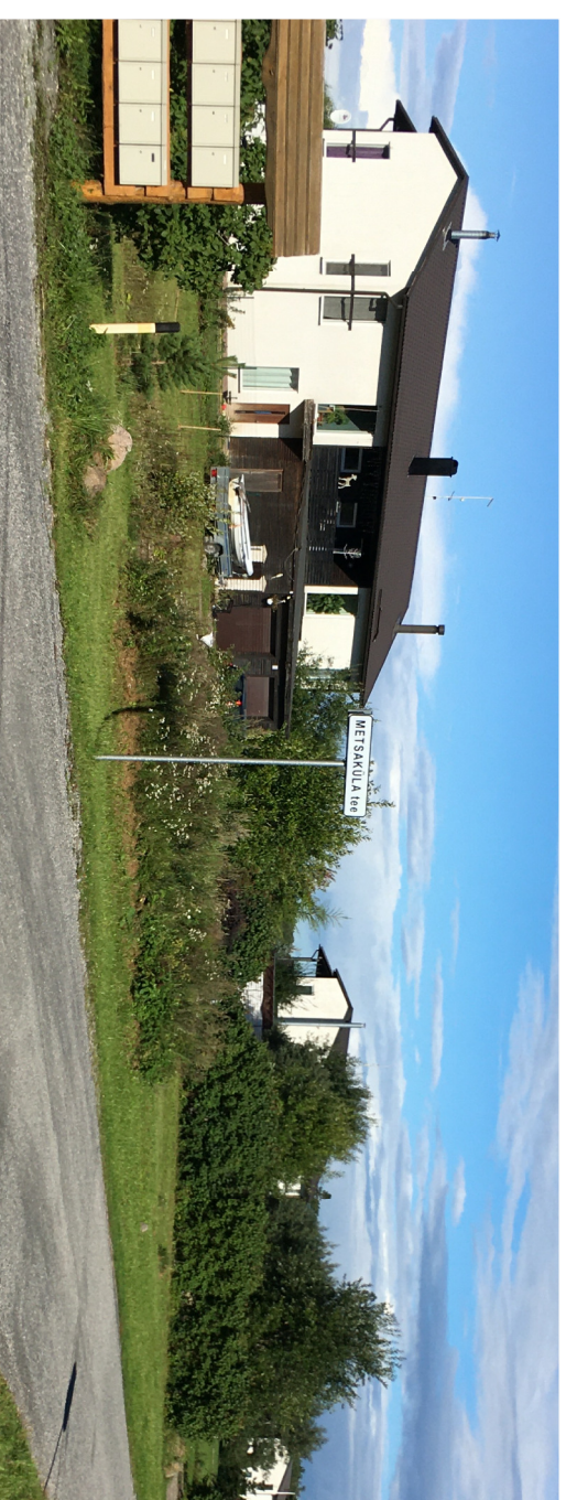
pildistatud 05.04.2020